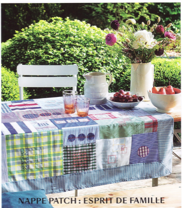
NAPPE PATCH : ESPRIT DE FAMILLE

C'EST L'ÉTÉ, SOYEZ CRÉATIFS! TISSUS FLEURIS AMBIANCE VOYAGE DÉCO CITRON L'ITALIE EN CUISINE