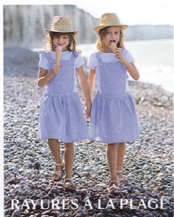
RAYURES À LA PLAGE