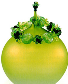
« Saurau'ra », collier en verre à la flamme de Karina Guévin sur vase en verre soufflé.