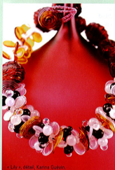
« Lily », détail, Karina Guévin.